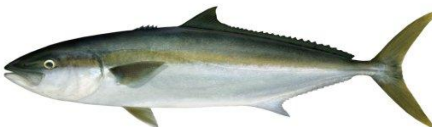
Figura 1. Jurel de castilla Seriola lalandi (Cuvier & Valenciennes, 1833).

La especie sobre la cual se llevara a cabo el torneo es el jurel de castilla Seriola lalandi (figura 1).