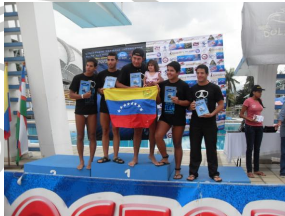
VALLA MENOS VENCIDA