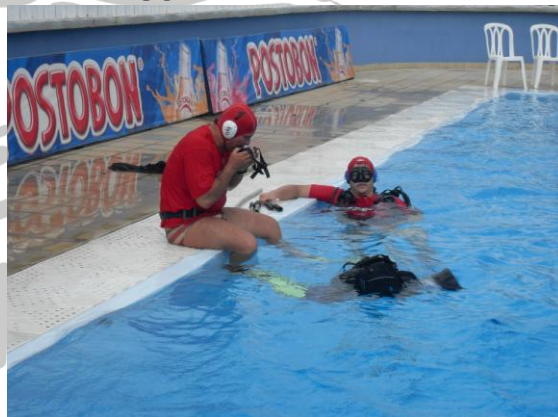
JUECES DE FONDO UNIFORMADOS