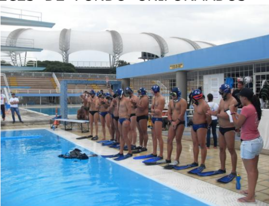
DOLPHIN'S PARTIDO FINAL