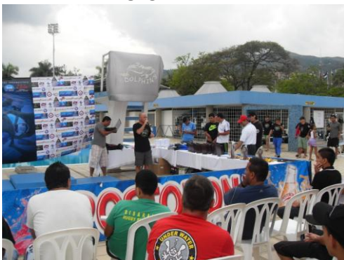
CEREMONIA DE CLAUSURA