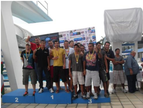
CACHALOTES B...TERCER PUESTO