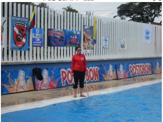
JUEZ DE SUPERFICIE