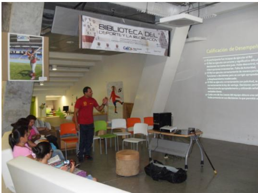
CAPACITACION DE JUECES