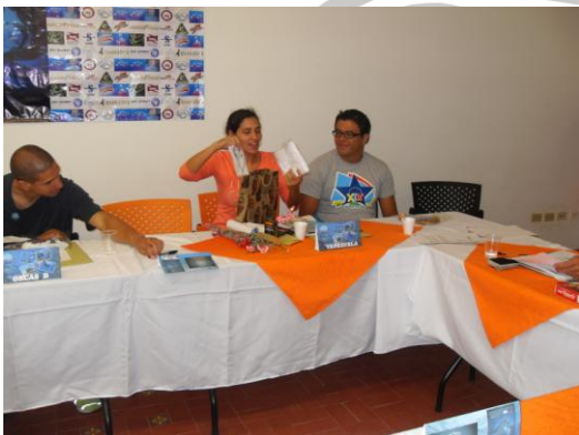
ENTREGA DE OBSEQUIOS