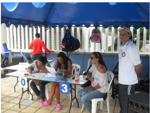
MESA DE CONTROL