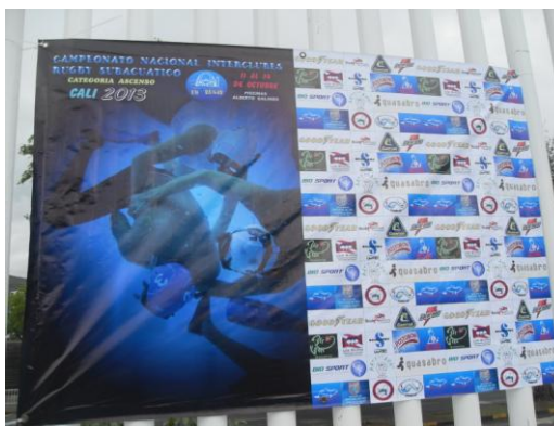
AFICHE OFICIAL CAMPEONATO