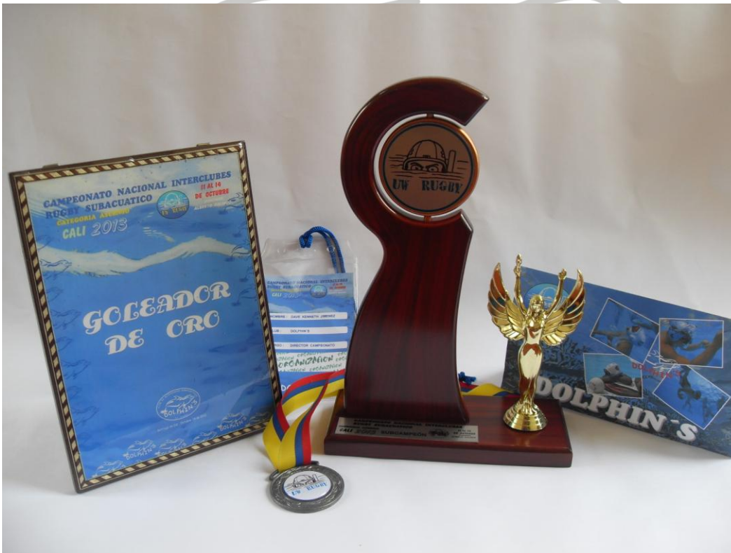
PLACAS – ESCARAPELAS – MEDALLAS – TROFEOS - HABLADORES