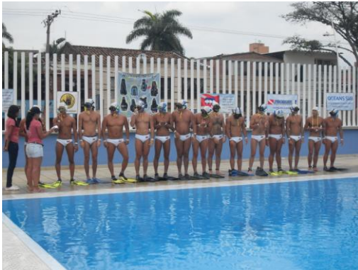
VENEZUELA PARTIDO FINAL